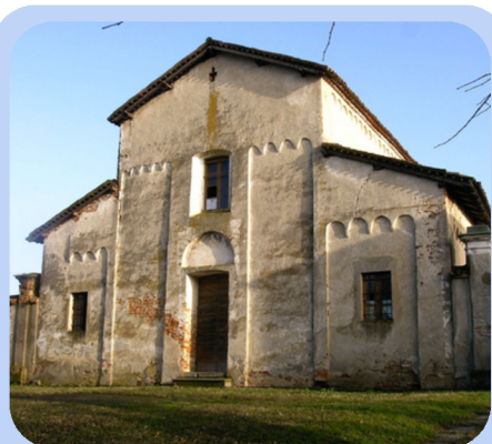
Chiesa di San Pietro

Apertura straordinaria con visita guidata gratuita.