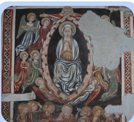
Parete dei Santi

XI Secolo. La prima certa testimonianza risale al 25 maggio 1194: proprio in questa chiesa fu stipulata la pace tra Novara e Vercelli (Pace di Casalino).